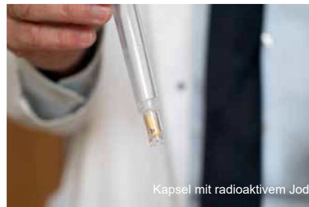
Kapsel mit radioaktivem Jod

Unter Berücksichtigung des Testergebnisses wird für Sie die individuell dosierte Therapiekapsel bestellt, die sich in Form und Größe nicht von anderen Arzeneikapseln (z.B. zur Blutdruckeinstellung) unterscheidet.